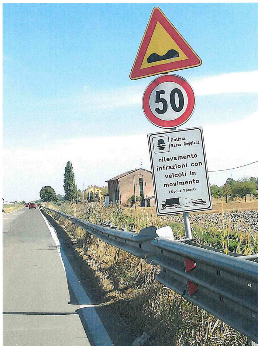
1. SP 1 KM 3+200 DIR. POVIGLIO