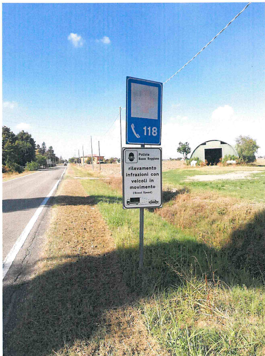
2. SP 1 KM 0+300 DIR. BRESCELLO